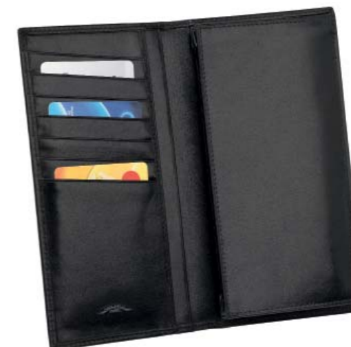
CODE 986NN0112 VERTICAL WALLET LC, 7 CC PORTAFOGLIO VERTICALE LC, 7 CC 165 x 90 mm.