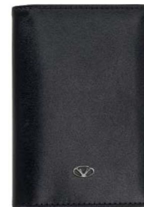
CODE 986NN0124 CREDIT CARD HOLDER, 2CC PORTACARTE DI CREDITO, 2CC 72 x 106 mm.