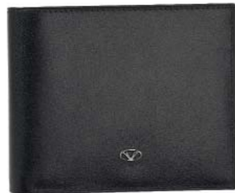
CODE 986NN0120 HORIZONTAL WALLET AND DOCUMENT HOLDER, 12 CC PORTAFOGLIO E PORTADOCUMENTI ORIZZONTALE, 12 CC 95 x 110 mm.