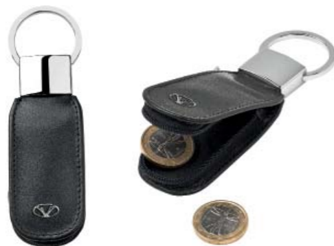
CODE 986NN0121 ZIP KEYRING PORTACHIAVI ZIP