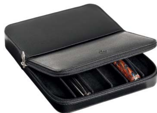
CODE 986NN0106 PENCASE (HOLDS SIX) PORTAPENNE SEI POSTI 135 x 160 mm.