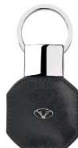
CODE 986NN0122 VISCONTI KEYRING PORTACHIAVI VISCONTI

Desk organiser: and when you finally get home and need to relax, we have the perfect desk organiser for your personal items, keys, loose change, watch and so on, and it even includes two holders for your pens!