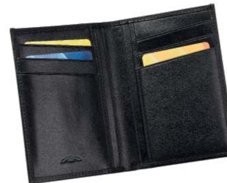
CODE 986NN0111 VERTICAL WALLET, 6 CC PORTAFOGLIO VERTICALE, 6 CC 120 x 80 mm.