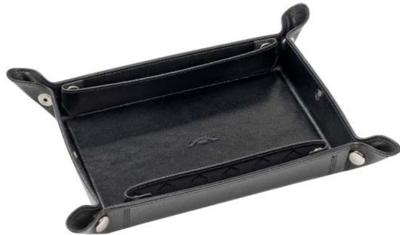
CODE 986NN0119 DESK ORGANISER SVUOTA TASCHE 125 x 185 mm.

E quando tornate a casa ecco lo svuota tasche per i vostri oggetti personali, chiavi, spiccioli, orologio e ben due contenitori per le vostre penne.