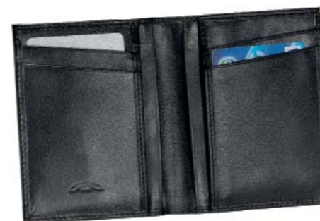
CODE 986NN0110 VERTICAL WALLET, 4 CC PORTAFOGLIO VERTICALE, 4 CC 110 x 85 mm.