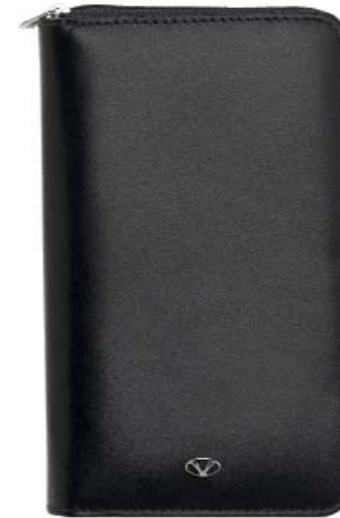
CODE 986NN0123 TRAVEL WALLET LC, 12CC PORTAFOGLIO DA VIAGGIO LC, 12CC 110 x 185 mm.

Portafoglio e documenti da viaggio: uno strumento pensato per viaggiare. Ben 12 carte di credito, portamonete, ampio spazio per documenti, banconote e due tasche esterne per passaporto e biglietti treno/aereo.