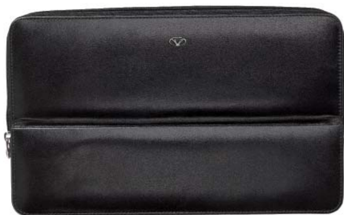
CODE 986NN0108 PENCASE (HOLDS TWELVE) PORTAPENNE DODICI POSTI 265 x 160 mm.